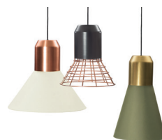
BELL LIGHT PENDANT LAMP 2013