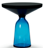
BELL SIDE TABLE 2012